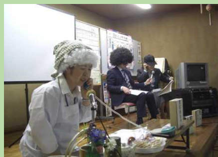
うまい話にご用心！（寸劇）