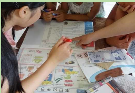
お買い物ゲームをやってみよう！