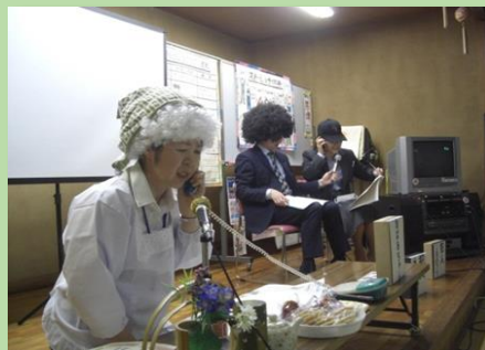
うまい話にご用心！（寸劇）