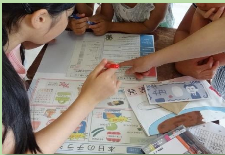
お買い物ゲームをやってみよう！